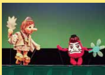
人形劇 「だるまちゃんてんぐちゃん」 [人形劇団ひよっこ/札幌]