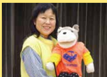
腹話術 「ジョンジョンとそのちゃん」 [そのちゃん/札幌]