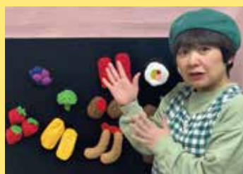
パネルシアター 「おべんとうぼこのうた」 [人形劇団キノッピー/愛別]