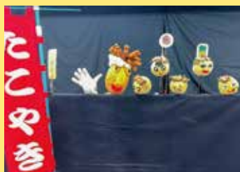
ボードビル 「たこ焼きマンボ」 [人形劇団地球防衛軍/旭川]