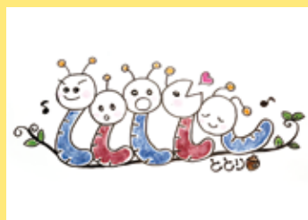
ボードビル 「ムニユムニユブラザーズ」ほか [手作り人形劇サークルトリ/旭川]