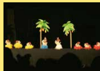
ボードビル 「南の島のハメハメハ大王」ほか [人形劇団VIVIDえんじえる/旭川]