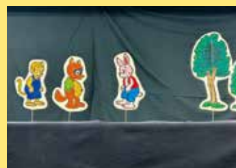
人形劇 「日天さん月天さん」 [人形劇団クレヨン/鷹栖]